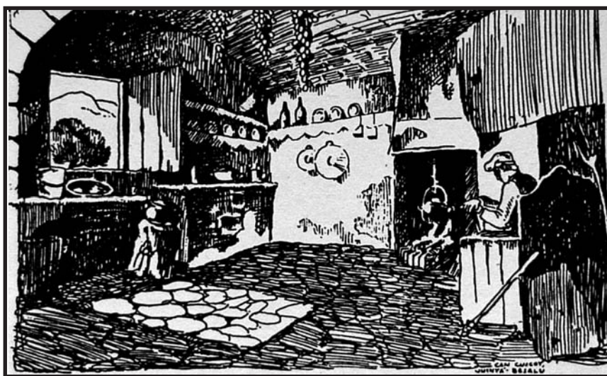
Dibuix a la ploma de M. Ricart: la cuina de can Coscoi (Junyà-Besalú).

institucions, entre d'altres, de l'ajuntament de Barcelona, la Generalitat de Catalunya i la mateixa Fundació Concepció Rabell i Cibils-Estudi de la Masia. El primer concurs va ser convocat la tardor de 1930, s'hi van presentar 118 dibuixos i es va premiar exclusivament aquells dibuixos presentats per membres de l'entitat.