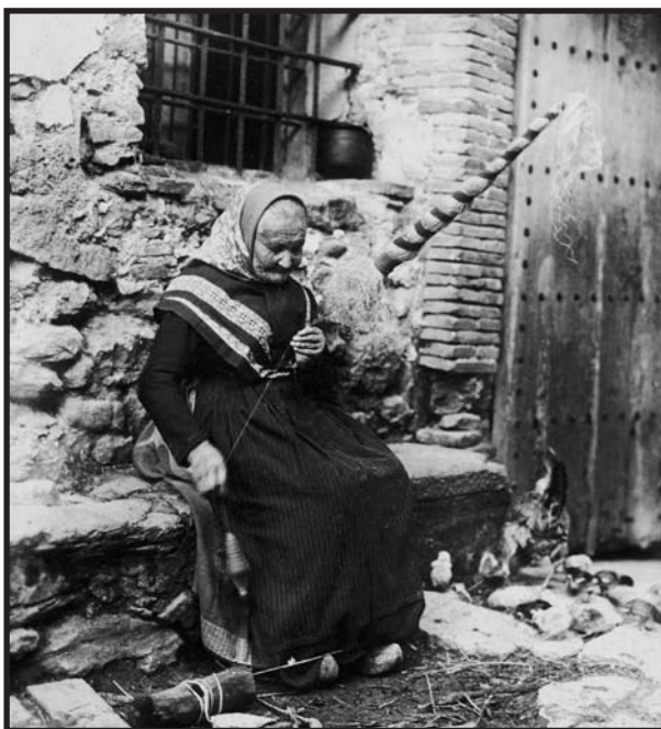
Per encàrrec de l'EMC, Amades va elaborar un estudi sobre el cultiu del lli i el cànem. A la imatge, una filadora de cànem (Ripoll, 1926).