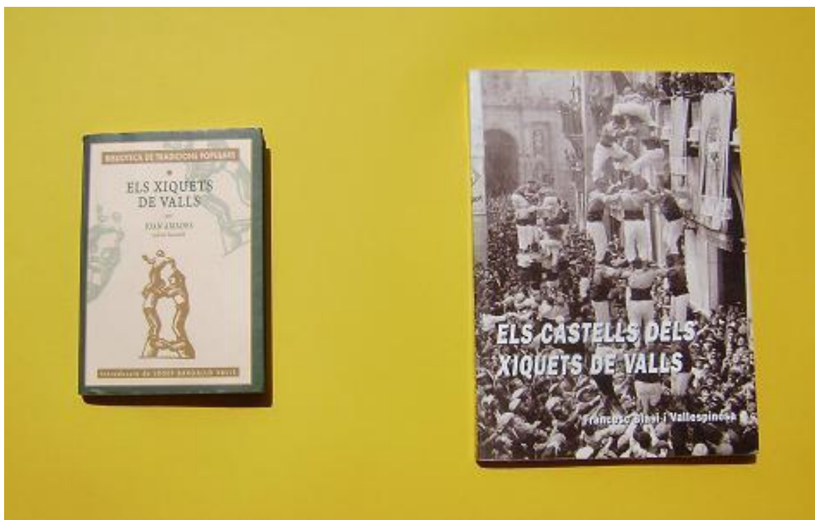
El llibre de Joan Amades (edició del 2001) i el de Francesc Blasi (edició del 1997)

A partir de la segona meitat del segle XIX s'escriuen diferents textos curts que parlen de castells: notícies de diari, poemes, articles en revistes i descripcions de festes majors. Però el primer llibre dedicat de forma monogràfica als castells no es va publicar fins l'any 1934. I, de fet, van ser dos: Els Xiquets de Valls de Joan Amades i Els castells dels Xiquets de Valls , de Francesc Blasi. El primer es va acabar el dia de 14 d'abril 1 i el segon el 31 de desembre 2 .