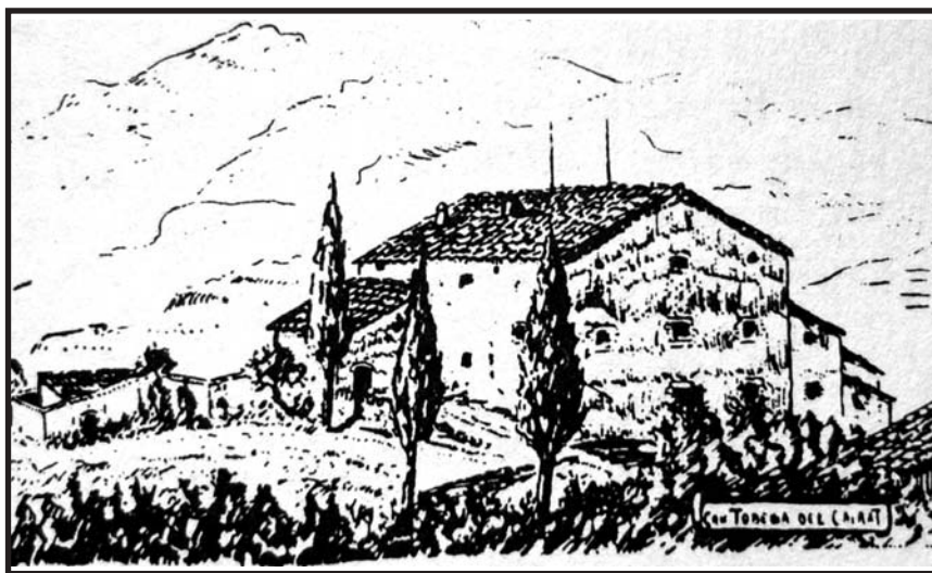
Dibuix a la ploma de J. Tobella: Can Tobella del Cairat, Esparreguera.

El treball sobre la indústria del lli i el cànem s'inscrivia dins de l'interès de l'EMC per l'estudi de la vida pagesa, i en concret, de les indústries casolanes. Amades rep l'encàrrec de dit estudi a data de 4 d'agost de 1932: