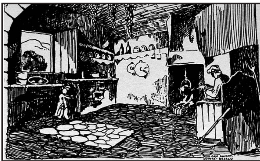
Dibuix a la ploma de M. Ricart: la cuina de can Coscoi (Junyà-Besalú).

institucions, entre d'altres, de l'ajuntament de Barcelona, la Generalitat de Catalunya i la mateixa Fundació Concepció Rabell i Cibils-Estudi de la Masia. El primer concurs va ser convocat la tardor de 1930, s'hi van presentar 118 dibuixos i es va premiar exclusivament aquells dibuixos presentats per membres de l'entitat.